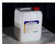
Clorhexidina Jabonosa al 2%