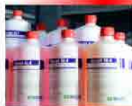
Clorhexidina Jabonosa al 4%